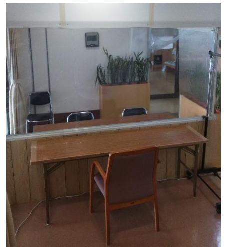
面会場所：面会専用ブース

予 約 : 電話にて受付 (Tel : 0794-66-7305) 予約受付時間 平日 10:00 ~ 17:00 面会希望日の前日の午前中まで お願いします。 面会希望日が月曜日の場合は 金曜日の午前中までお願いします。