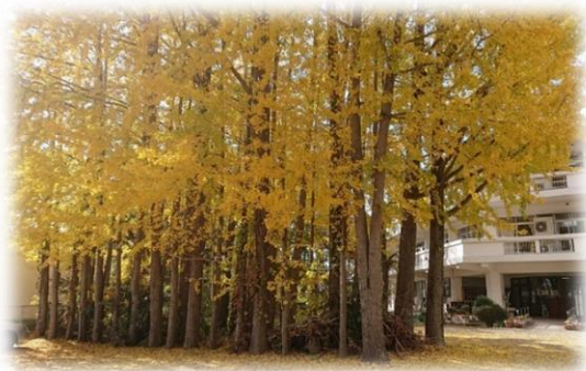
青山荘裏庭の銀杏並木

青山荘は、引き続き安全安心の介護と健全経営に努め、ご利用者様やご家族のご意見を傾聴し、さらなる介護環境の改善に取り組み、ご満足いただけるように日々力を注いでまいります。 本年もよろしくお願い申し上げます。